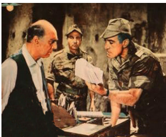
1965 LES CENTURIONS (Lost Command) de Mark Robson avec Jack Warden, Anthony Quinn