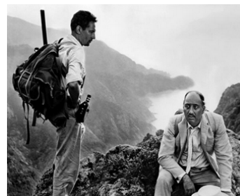
1958 ALERTE EN EXTRÊME-ORIENT (Windom's Way) de Ronald Neame avec Peter Finch