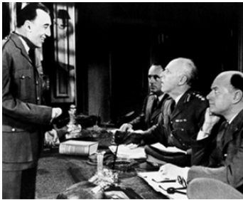
1960 L'ESCAPADE HÉROÏQUE (Invasion quartet) de Jay Lewis avec Cyril Luckham