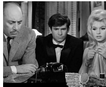
1964 UNE RAVISSANTE IDIOTE d'Édouard Molinaro avec Anthony Perkins, Brigitte Bardot