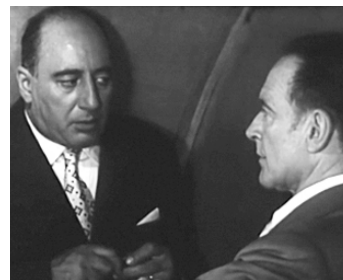
1957 LES FANATIQUES d'Alex Joffé avec Pierre Fresnay