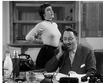
1954 LA RAFLE EST POUR CE SOIR de Maurice Dekobra avec Isabelle Eber