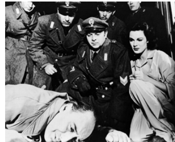
1955 MONSIEUR ARKADIN (Confidential Report) d'Orson Welles avec Patricia Medina