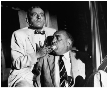
1959 NOTRE AGENT DE LA HAVANE (Our Man in Havana) de Carol Reed avec Alec Guinness