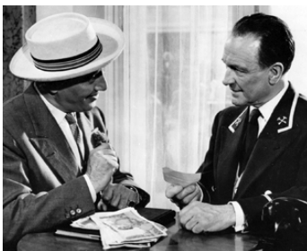
1956 L'HOMME AUX CLÉS D'OR de Léo Joannon avec Pierre Fresnay