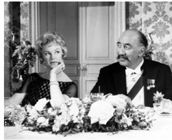
1964 LA ROLL-ROYCE JAUNE (The yellow Roll-Royce) d'A. Asquith avec Moira Lister