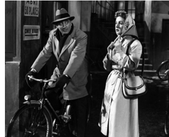
1953 LE BON DIEU SANS CONFESSION de Claude Autant-Lara avec Danielle Darrieux