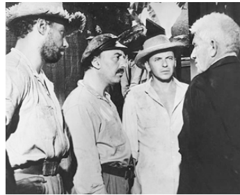
1961 LE DIABLE À 4 HEURES (Devil at four o'clock) de M. Le Roy avec F. Sinatra, S. Tracy