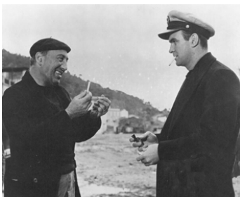
1958 REQUINS DE HAUTE MER (Sea Fury) de Cy Enfield avec Stanley Baker