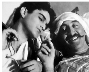
1956 CELUI QUI DOIT MOURIR de Jules Dassin avec Carl Möhner