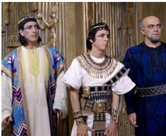
1963 CLÉOPÂTRE (Cleopatra) de Joseph L. Mankiewicz avec R. O'Sullivan, H. Berghof