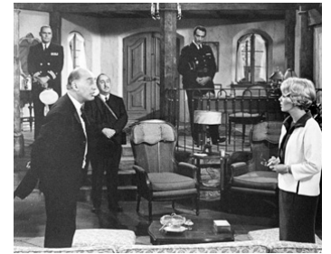
1965 CHOC (Moment to Moment) de Mervyn Le Roy avec Jean Seberg