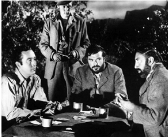
1951 LES AVENTURIERS (The Adventurers) de David MacDonald avec D. Price, J. Hawkins