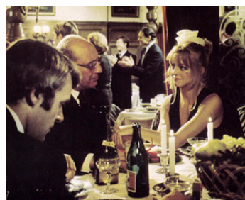
1974 LA FILLE DE LA RUE PETROVSKA (The Girl from Petrovska) de R. E. Miller avec A. Hopkins, G. Hawn