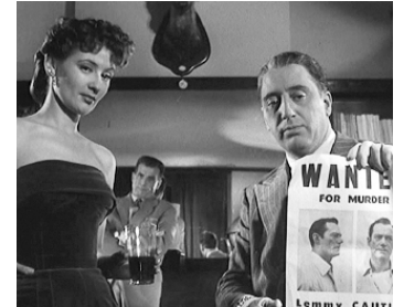
1953 CET HOMME EST DANGEREUX de Jean Sacha avec Colette Deréal