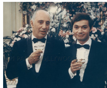
1968 MAZEL TOV OU LE MARIAGE de et avec Claude Berri