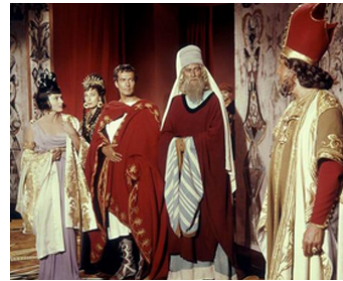
1961 LE ROI DES ROIS (King of Kings) de Nicholas Ray avec V. Lindfors, Rita Gam, Hurd Hatfield