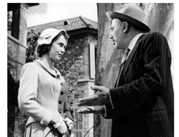
1958 CRIME SANS INDICES (The Snorkel) de Guy Green avec Mandy Miller