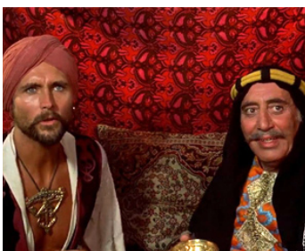
1973 LE VOYAGE FANTASTIQUE DE SINBAD de Gordon Hessler avec John Phillip Law