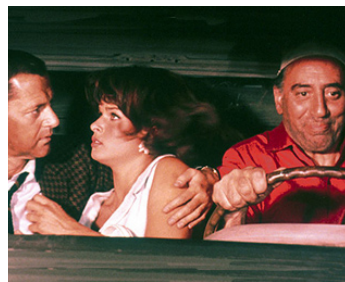
1966 OPÉRATION MARRAKECH (Bang, Bang ! you're dead) de Don Sharp avec T. Randall, Senta Berger