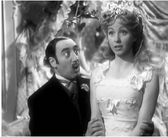
1949 OCCUPE-TOI D'AMÉLIE de Claude Autant-Lara avec Danielle Darrieux