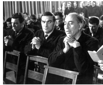
1960 LES CRIMINELS (The Criminal) de Joseph Losey avec Stanley Baker