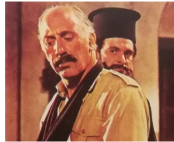
1965 DERNIÈRE MISSION À NICOSIE (The high bright sun) de Ralph Thomas avec P. Stassino