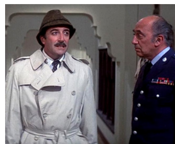
1975 LE RETOUR DE LA PANTHÈRE ROSE de Blake Edwards avec Peter Sellers