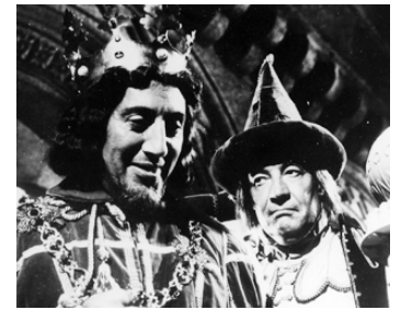
1960 LES VOYAGES DE GULLIVER (The 3 Worlds of Gulliver) de Jack Sher avec Charles Lloyd