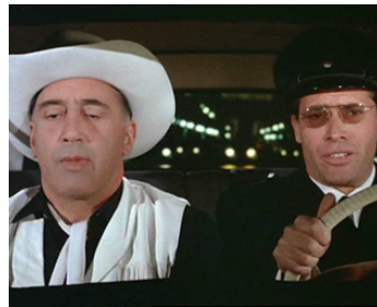
1963 DEUX TÊTES FOLLES (Paris when it sizzles) de Richard Quine avec Henri Garcin