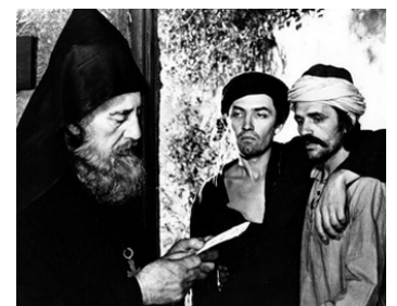
1976 RENCONTRE AVEC DES HOMMES REMARQUABLES de Peter Brook