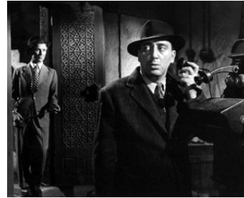
1950 LA ROUTE DU CAIRE (Cairo Road) de David MacDonald avec Eric Portman