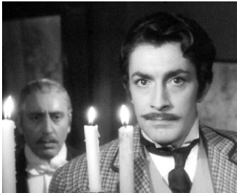
1954 LE CHEVALIER DE LA NUIT de Robert Darène avec Jean-Claude Pascal