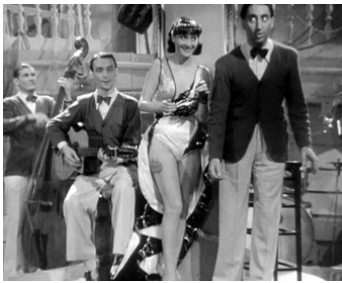
1936 AVENTURE À PARIS de Marc Allégret avec Loulou Gasté, Arletty