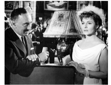
1961 LES JOYEUX VOLEURS (The happy Thieves) de George Marshall avec Rita Hayworth